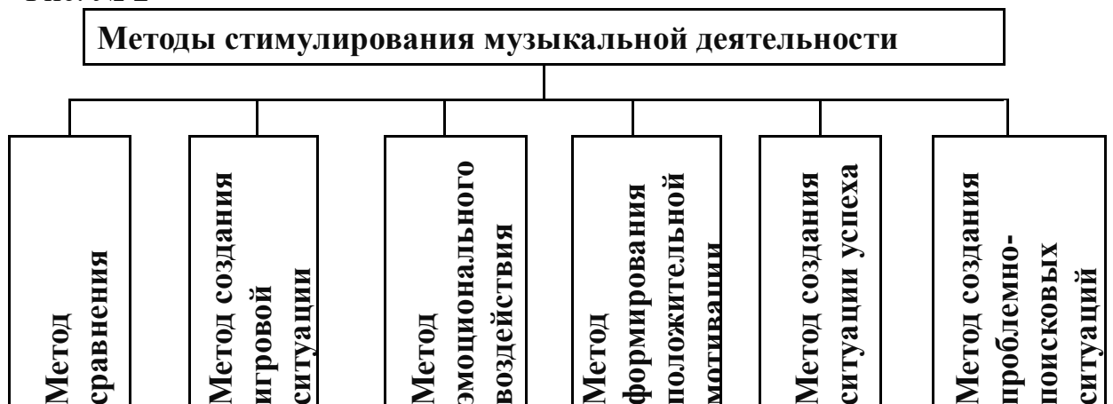
Рис. № 2

Частично – поисковый метод предназначен для решения проблемных ситуаций (рассуждения и нахождение верного ответа).